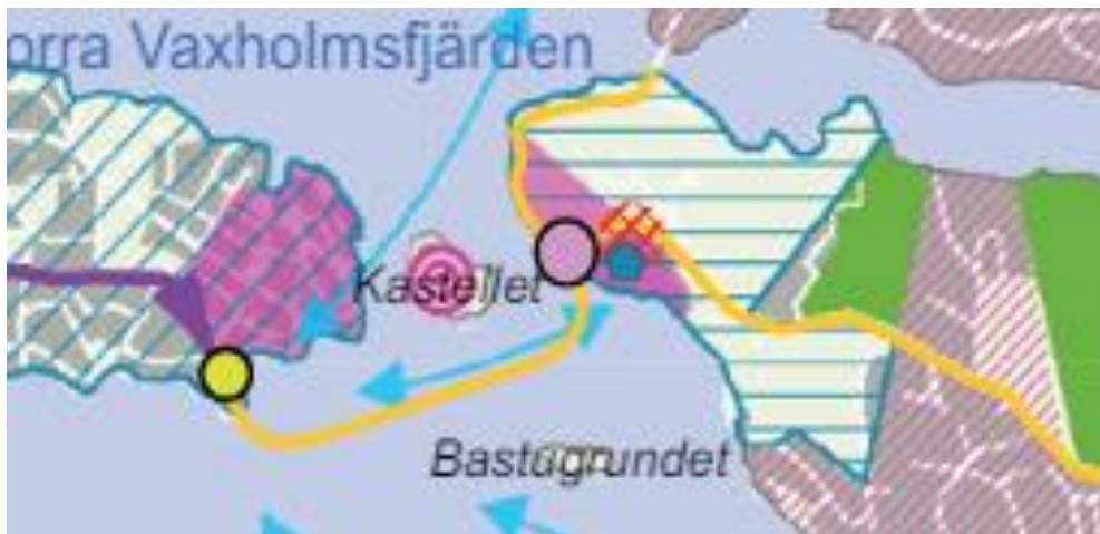
Figur 3 - Bilden visar Rindö Smedja (fastigheten Rindö 2:256) på Rindö från Vaxholms översiktsplan 2030.

2012 tecknade Fortifikationsverket och Vaxholms stad ett avtal om att ta fram ett planprogram för ny bebyggelse för Rindö Smedja som bland annat innefattar fastigheten Rindö 2:256. Planprogrammet har varit ute på samråd under 2015 men inte gått vidare till godkännande. Fastigheten Rindö 2:256 bedöms fortsatt vara av intresse för Vaxholms stad.