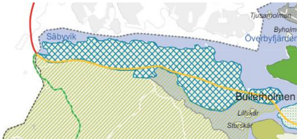
Figur 2 - Bilden visar Norra Bogesund (del av Bogesund 1:1) från Vaxholms översiktsplan 2030.